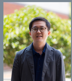
WRITTEN BY 장진원 목사님

교만했던 왕이 하나님 나라의 진리를 선포하게 되었습니다. 하나님은 이교도이며 폭군인 느부갓네살에게 아무 조건 없이 은혜를 베푸셨습니다. 하나님이 원하시는 지도자, 하나님이 원하시는 사람은 자신의 무능력과 무기력을 인정하며, 하나님 앞에 내세울 것이 아무것도 없음을 고백하는 사람입니다. 그래서 느부갓네살이 그랬던 것처럼 하나님을 찬양하며 칭송하며 경배하는 사람이 되는 것입니다. 느부갓네살의 고백처럼 하나님을 높이시는 원미니스트리 가족분들 되시기를 축원합니다.