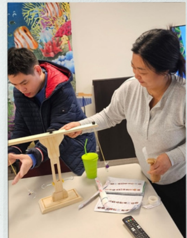
Ring Toss Hook & Ring Game