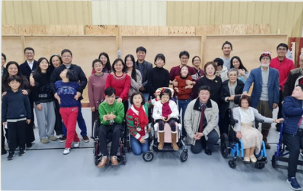
따뜻했던 가족 모임