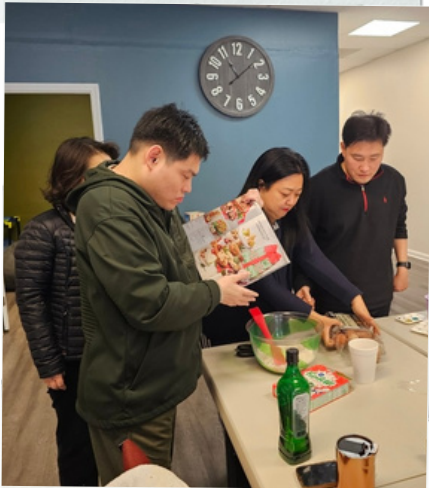
레시피 확인해 볼게요