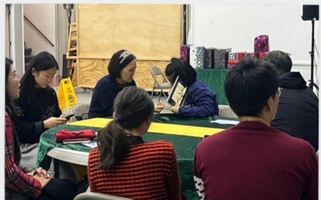
온 가족이 함께 한 시간