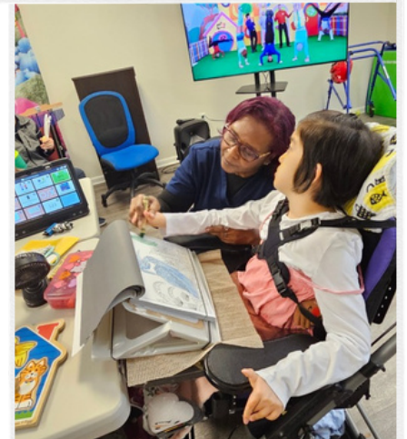
행복한 미술 시간