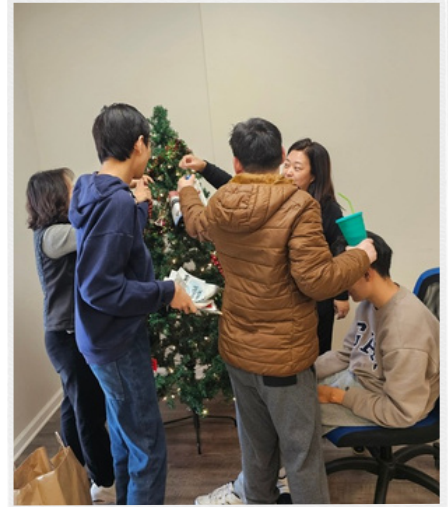
다함께 트리 장식