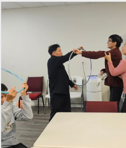
백지장도 맞들면 낫다