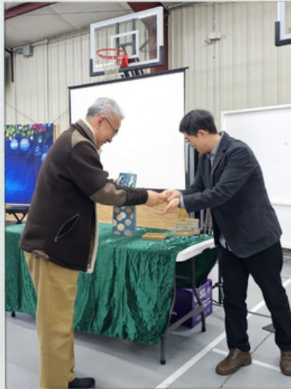
신나는 경품 행사