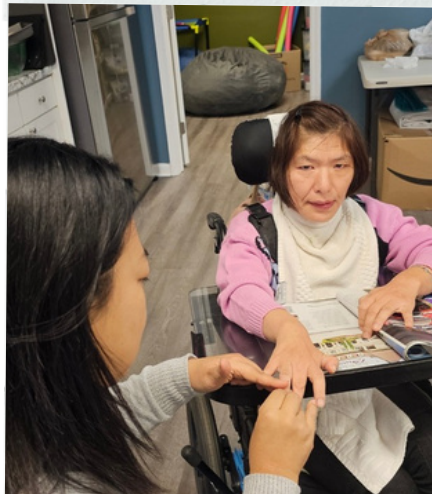
즐거운 네일 관리